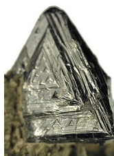
La tetraedrite in natura

Tetraedrite e recupero del calore dalle acque di raffreddamento alzano il TRL dei dispositivi termoelettrici