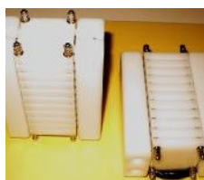
TEGs ad alta densità di potenza dalla AIST.

Segnaliamo infine un report (a pagamento) sul mercato dell'harvesting termoelettrico.