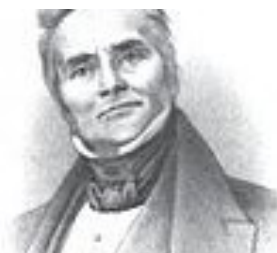
Jean Charles Athanase Peltier in un ritratto di anonimo del XIX secolo.

Il 4 settembre si è tenuta la prima riunione del Consiglio Direttivo dell'AIT seguita dall'Assemblea dei soci. Si è trattato, come ovvio, di due atti formali ma necessari alla regolare apertura della campagna associativa. I verbali di entrambe le assisi sono disponibili sul sito GiTe. In sintesi estrema, il Consiglio Direttivo ha dato mandato al Presidente di aprire un conto corrente bancario e ha espresso il proprio parere favorevole a che la nascita dell'AIT venga comunicata quanto prima alla European Thermoelectric Society . L'Assemblea ha invece