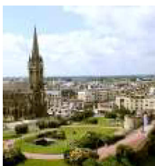
ICT-ECT 2018 a Caen, in Normandia

C'è tempo fino al 31 gennaio per concorrere al premio AIT per il migliore articolo junior 2017