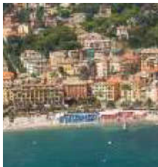
Santa Margherita Ligure attende la comunità termoelettrica italiana

C'è tempo fino al 31 gennaio per concorrere al premio AIT per il migliore articolo junior 2017